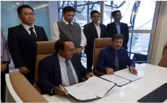
ముచ్చర్ల మీర్ఖాన్ పేట్లో మరో సంస్థ నిర్వహిస్తున్న సీఎం రేవంకెరెడ్డి ఆహ్వానించారు. డేటా సెంటర్ డేటా సెంటర్ను ఏర్పాటు చేయనుంది. ఎస్టీటీ డేటా సెంటర్ హాట్గా హైదరాబాద్ మారుతోందని హర్షం వ్యక్తం చేశారు.