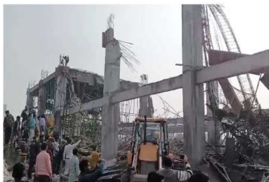
ఉత్తరప్రదేశ్ కన్పూర్ రైల్వేస్టేషన్లో నిర్మాణంలో ఉన్న ప్రవేశద్వారం పైకప్పు ఒక్కసారిగా కుప్పకూలింది. దాంతో నిర్మాణ పనులు చేస్తున్న పలువురు కూలీలు శిథిలాల కింద చిక్కుకున్నారు. ఘటనపై సమాచారం అందిన వెంటనే రెస్క్యూ టీమ్స్ హుటాహుటిన అక్కడికి చేరుకున్నాయి. సహాయక చర్యలు మొదలుపెట్టాయి. శిథిలాల కింది చిక్కుకున్న 11 మందిని వెలికితీశాయి. వారికి తీవ్ర గాయాలు కావడంతో చికిత్స నిమిత్తం హుటాహుటిన ఆస్పత్రికి తరలించాయి.వారిలో ఇద్దరి పరిస్థితి విషమంగా ఉందని అధికారులు తెలిపారు. శిథిలాల కింద చిక్కుకున్న ఉన్న మిగతా కూలీలను రక్షించేందుకు సహాయక చర్యలు కొనసాగుతున్నాయి. రెస్క్యూ టీమ్స్ తోపాటు స్థానిక అధికారులు, పోలీసులు ఈ సహాయక చర్యల్లో పాల్గొన్నారు.