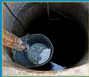
చత్తీస్ గఢ్ నీటిలో ప్రమాదకరమైన యురేనియం