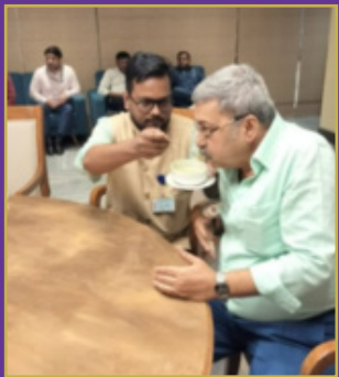
గాజు సీసాను పగలగొట్టి గాయపర్చుకున్న ఎంపీ