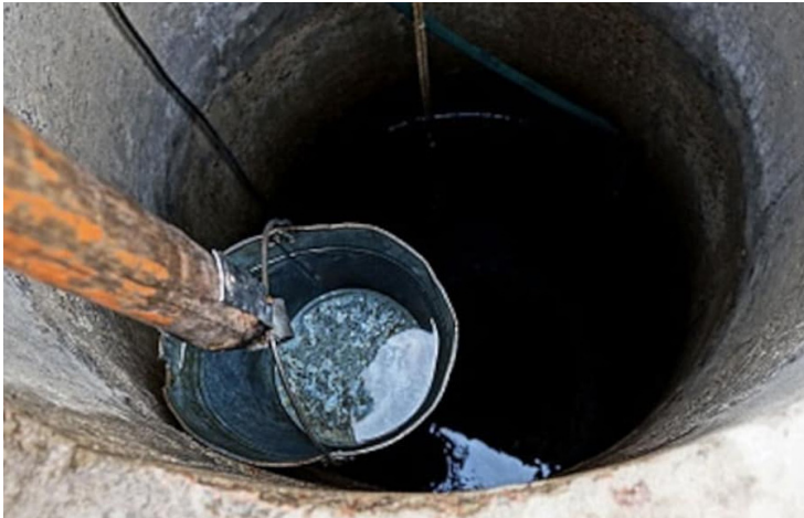
ముందడుగు ఛత్తీస్ గడ్:

ఛత్తీస్ గడ్ లోని 6 జిల్లాల్లోని నీటిలో ప్రమాదకరమైన స్థాయిలో "యురేనియం" ఉందని తెలిసింది. అణు కార్యక్రమాల్లో ఉపయోగించి యురేనియం మోతాదుకి మించి నీటిలో ఉండటం ప్రమాదాన్ని సూచిస్తోంది. ప్రపంచ ఆరోగ్య సంస్థ ప్రకారం.. ఒక లీటర్ నీటిలో 15 మైక్రో గ్రాముల పరిమిత, ప్రభుత్వం ప్రకారం లీటర్ నీటిలో 30 మైక్రో గ్రాములతో పోలిస్తే ఈ నీటిలో యురేనియా మూడు నుంచి నాలుగు రెట్లు అధికంగా ఉంది. నీటిలో ఈ స్థాయిలో యురేనియం ఉండటం ప్రజల్లో క్యాన్సర్లు, ఊపిరితిత్తుల రోగాలు, చర్మ, మూత్రపిండాలు వ్యాధులకు