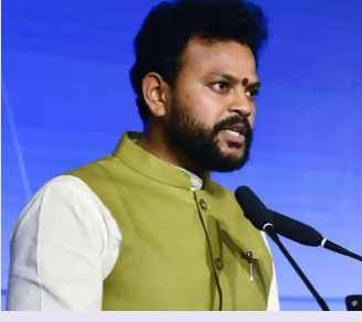
చట్టపరమైన మార్పులు తెచ్చేందుకు యత్నిస్తున్నామన్నారు.

నయాన శాఖకు కఠినమైన ప్రొటోకాల్ ఉందని.. దానినే తమ శాఖ, విమానయాన సంస్థలు అనుసరిస్తోందని వివరించారు. ఇలాంటి బెదిరింపులు వచ్చిన సమయంలో పరిస్థితి చాలా సున్నితంగా ఉంటుందన్నారు. అంతర్జాతీయ విధివిధానాలను మనం అనుసరించాలని ఆయన వ్యాఖ్యానించారు. బెదిరింపు కార్ల్స్, సోషల్ మీడియా పోస్టులకు పాల్పడేవారికి జీవిత ఖైదు విధించేలా