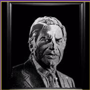
రతన్ టాలూ 12 వేల వజ్రాల చిత్రం వేలం