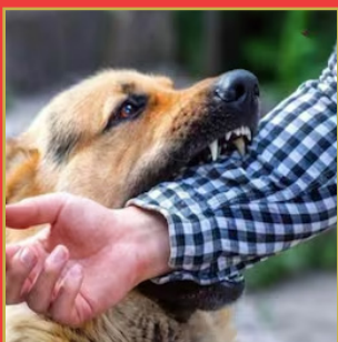
కుక్క కలిచిన వెంటనే ఇలా చేయండి