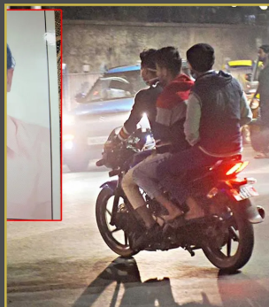
బైక్పై రాష్ గా వెళుతున్న యువకుడు