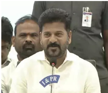
జీవితం ఇవ్వాలనేది ఈ ప్రభుత్వ ఆలోచన. మల్లన్న సాగర్, వేమలఘాట్ లో ఏం జరిగిందో గుర్తు తెచ్చుకోవాలి.

మూసీ దుర్గంధంలో మగ్గిపోతున్న వారికి మెరుగైన జీవితం ఇవ్వాలని మూసీనది అభివృద్ధి ప్రాజెక్టు తలపెట్టామని ముఖ్యమంత్రి రేవంత్ రెడ్డి తెలిపారు. నగరం మధ్య గుండా నది వెళ్తున్న రాజధాని మరొకటి ఈ దేశంలో లేదు. దాదాపు 300 కి. మీ ప్రవహించే మూసీకి ఎంతో చరిత్ర, విశిష్టత ఉంది. మేం చేపడుతున్నది మూసీ సుందరీకరణ కాదు.. మూసీ నది పునరుజ్జీవం. కొందరు మెదడులో మూసీలో ఉన్న మురికికంటే ఎక్కువ విషం నింపుకొన్నారు. మెదడులో విషం నింపుకొని మూసీ ప్రాజెక్టుపై దుష్ప్రచారం చేస్తున్నారు. మూసీ పరివాహక ప్రజలకు మంచి