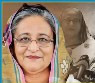
బంగ్లా మాజీ ప్రధాని షేక్ హసీనా అరెస్టుకు వారెంట్..