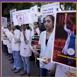
మరో 60 మంది సీనియర్ డాక్టర్లు రాజీనామా

SIMULTANEOUSLY PUBLISHED FROM HYDERABAD | KARIMNAGAR | WARANGAL | JAGITYAL | KHAMMAM | NALGONDA | MAHABOBNAGAR | NIZAMABAD