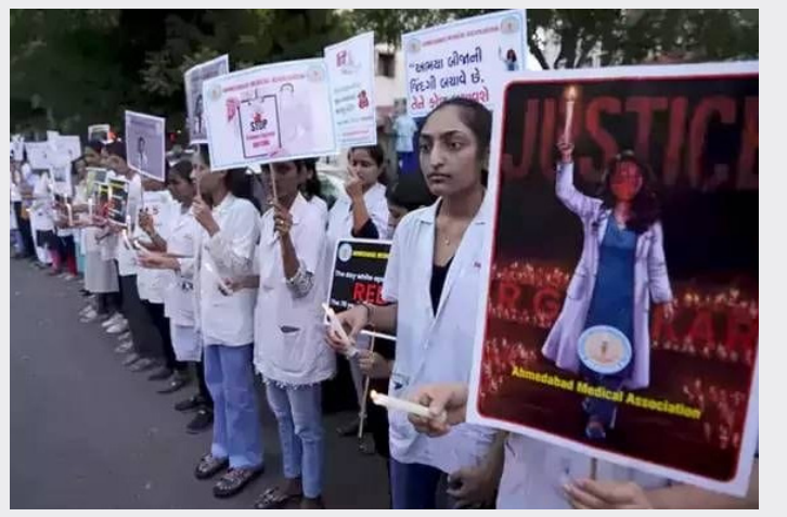
కోల్కతాలోని ఆర్జీ కర్ ప్రభుత్వ అత్యాచార ఘటన దేశవ్యాప్తంగా కళాశాల అనుపత్రిలో అగస్టు 9న సంచలనం సృష్టించిన విషయం జూనియర్ వైద్యురాలిపై జరిగిన తెలిసింది.