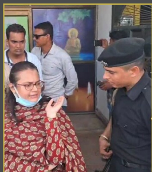
స్వా సెంటర్ తాళాలు పగలకొట్టించిన కలెక్టర్