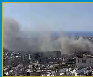
ఇరాన్ అణుస్థావరాలపై దాడి చేద్దాం