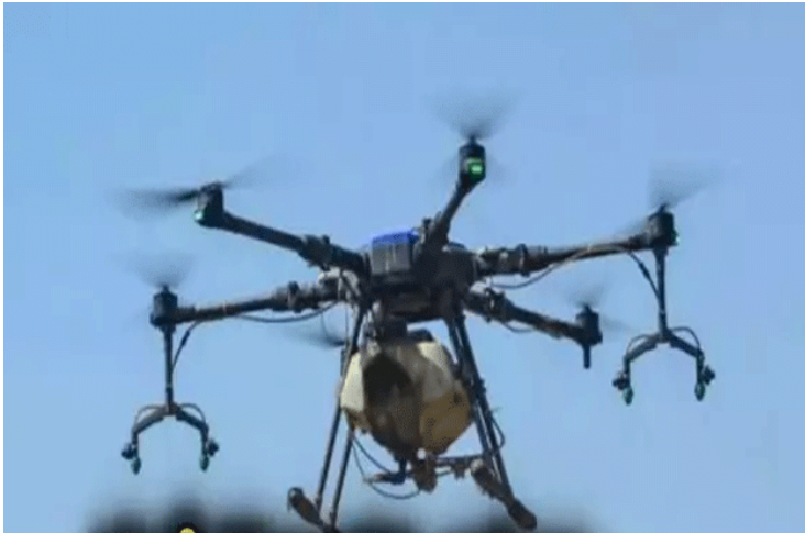
ముందడుగు హిమాచల్ ప్రదేశ్: