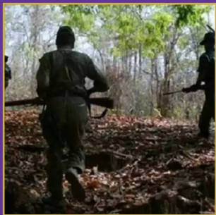
తుపాకీ తూటాలతో దద్దరిల్లిన దండకారణ్యం