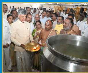
ఒకేసారి 1.20 లక్షల మంది యాత్రికులకు అన్నప్రసాదం