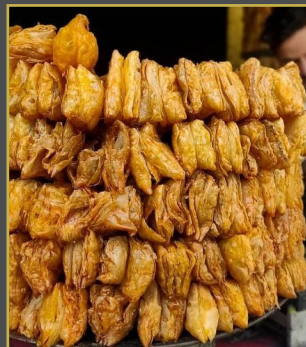
ఏడాదిలో నెల మాత్రమే దొరికే స్వీట్