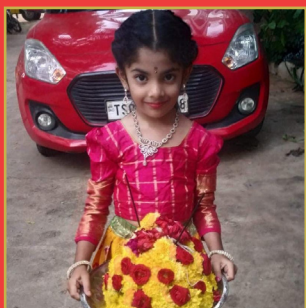
ముందడుగు సెల్ఫీ కాంటెస్ట్