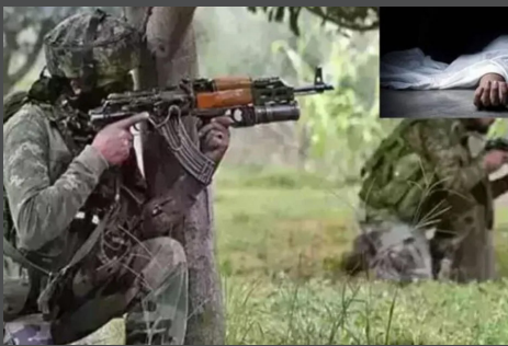
ముందడుగు ఛత్తీస్ గఢ్:

ఛత్తీస్ గఢ్ రాష్ట్రంలో శుక్రవారం భారీ ఎన్ కౌంటర్ జరిగింది. ఈ ఎదురుకాల్పుల్లో 30 మంది మావోయిస్టులు మృతి చెందారు. బస్తర్ రేంజ్ లోని దంతవాడ- నారాయణ్ పుర్ సరిహద్దులో ఎన్ కౌంటర్ జరిగినట్లు పోలీసు అధికారులు తెలిపారు. ఘటనా స్థలంలో పలు ఆయుధాలతోపాటు భారీగా పేలుడు పదార్థాలు స్వాధీనం చేసుకున్నట్లు వెల్లడించారు. ఇటీవల కాలంలో జరిగిన అతిపెద్ద ఎన్ కౌంటర్ లో ఇదొకటి కావడం గమనార్హం.