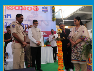
మెరుగైన సమాజానికి అహింసా మార్గమే అవసరం