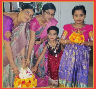
తెలంగాణలో మొదలైన బతుకమ్మ సందడి పూల రంగులతో ఎరుపెక్కిన పల్లెలు