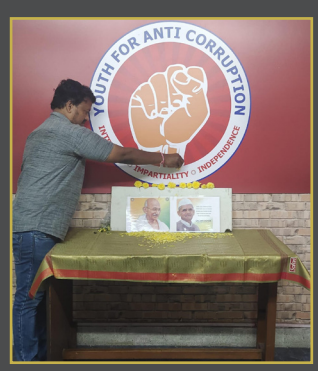
అహింసా మార్గంతోనే అవినీతి రహిత సమాజం