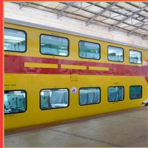
డబుల్ డెక్కర్ రైళ్లలో భారీగా మార్పులు