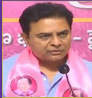
ఫార్మాసిటీ రద్దు వెనుక కోట్ల భూ కుంభకోణం

ప్రధాని నరేంద్ర మోడీ ప్రజలను విభజించి పాలిస్తున్నారనీ, ఒకరిని చూసి మరొకరు అసహ్యించుకునేలా తయారు చేశారని లోక్ సభ ప్రతిపక్షనేత రాహుల్ గాంధీ మండిపడ్డారు. హరియాణా అసెంబ్లీ ఎన్నికల ప్రచారంలో భాగంగా ఆయన చండీగఢ్ లో పర్యటించారు. హరియాణాలో బిజెపి కుప్పకూలడం ఖాయమని, తాజా ఎన్నికల్లో కాంగ్రెస్ పార్టీ ప్రభుత్వాన్ని ఏర్పాటు చేస్తుందని ఢిమా వ్యక్తం చేశారు. "కాంగ్రెస్ తుపాను రాబోతోంది. అందులో భాజపా కొట్టుకుపోవడం పక్కా. రాష్ట్రాన్ని ఆ పార్టీ సర్వనాశనం చేసింది. అందుకు ప్రజలు కచ్చితంగా బుద్ధి చెబుతారు. ఇటీవల అమెరికా వెళ్లినప్పుడు అక్కడ ఉంటున్న హరియాణా వాసులను కలిశాను. డల్ హాస్, టెక్సాస్ లో ఒక్కో గదిలో 15 నుంచి 20 మంది ఉన్నారు. మగతా 2లో