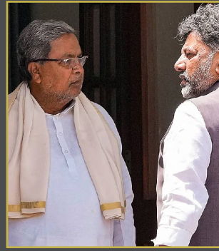
రాష్ట్రంలో సీబీఐకి అనుమతి లేదు