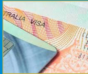
భారతీయులకు వర్క్, హాలీడే వీసాలు