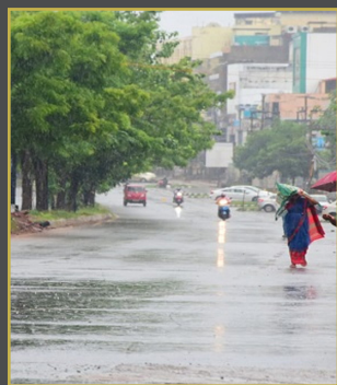
తెలంగాణలో పలు జిల్లాలకు ఎల్లో అలెర్ట్