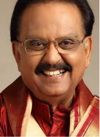
పాటు తమిళం, మలయాళం, కన్నడ, హిందీ, మారాఠీ తదితర భాషల్లో

దివంగత గాయకుడు ఎస్పీ బాలసుబ్రహ్మణ్యం గౌరవార్ధం తమిళనాడు ప్రభుత్వం కీలక నిర్ణయాన్ని తీసుకున్నది. తమిళనాడు రాజధాని చెన్నై నగరంలోని ఓ రోడ్డుకు ఎస్పీబీ పేరును పెట్టింది. బాల సుబ్రహ్మణ్యం నుంగంబాక్కం ఏరియాలో నివాసం ఉండేవారు. నుంగంబాక్కంలోని కాందార్ నగర్ మెయిన్ రోడ్డుకు స్టాలిన్ ప్రభుత్వం ఎస్పీబీ పేరు పెట్టింది. ఇకపై కాందార్ నగర్ మెయిన్ రోడ్డును ఎస్పీ బాలసుబ్రహ్మణ్యం రోడ్ గా పిలువనున్నారు. ఈ మేరకు సీఎం స్టాలిన్ కార్యాలయం ప్రకటన విడుదల చేసింది. ఎస్పీబీ తెలుగుతో