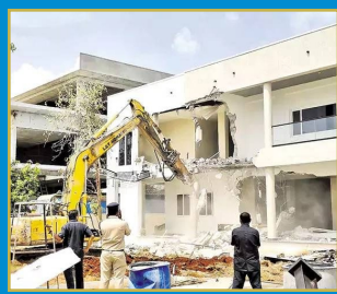
హైద్రాబాద్ కు 169 మంది సిబ్బంది కేటాయింపు