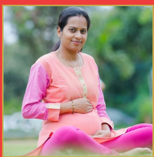
సిబిఎస్ గర్భాన్ని ఎలా ప్రభావితం చేస్తుంది