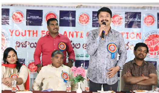
ప్రముఖ సంగీత దర్శకులు ఆర్పీ పట్నాయక్ మాట్లాడుతూ

ప్రజల కోసం పనిచేసే ప్రభుత్వ అధికారి ప్రవర్తన ఏలా ఉందో ప్రజలు చెప్పాలి. అవినీతి నిర్మూలనకు టెక్నాలజీని ఉపయోగించి బయటికి రావాలి. ప్రజా ఉద్యమాలను తీసుకొచ్చే వ్యక్తులు తగ్గిపోతున్నారు. ఉద్యోగుల ఎంపికలో రాజకీయ పైరవీలకు తా వివ్వకుండా పారదర్శకంగా జరగాలి. నిజాయితీ అధికారులు మీ మీ పరిధిలో గొప్ప ప్రయత్నం చేశారు. నిజాయితీ అధికారుల సంతతి పెరగాలి. నిజాయితీ అనేది స్కూల్, ఇల్లు, దేవాలయంలో పెరగాలి. మంచి వ్యక్తులతోనే మంచి పాలన, విలువలు గల సమాజం ఏర్పడుతుందన్నారు. మీ అందరిని వెతకడం కోసం మా సంస్థ పెద్ద ప్రయోగమే చేసినట్లు తెలుస్తోంది.. ఇప్పటి సమాజంలో నిజాయితీగా గుర్తింపు తగ్గిపోతుంది. ఆ గుర్తింపు యూత్ ఫర్ యాంటీ కరప్షన్ సంస్థ ఇవ్వడం చాలా గర్వకారణం.. ఇలాంటి కార్యక్రమాలు ప్రతి సంవత్సరం సాగుతూ ఉండాలి..