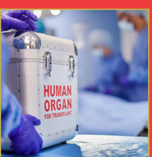
అవయవదానంలో మహిళలే ముందంజ మగతా 4లో