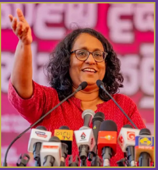
శ్రీలంక నూతన ప్రధానిగా హరిణి అమరసూర్య మగతా 2లో

మనదేశంలో సెక్యూరిటీకి స్థానం లేదని అది యూరప్ భావన అంటూ తమిళనాడు గవర్నర్ ఆర్ఎన్ రవి చేసిన వ్యాఖ్యలు తీవ్ర దుమారాన్ని రేపతున్నాయి. ఇప్పటికే పలుమార్లు వివాదస్పద వ్యాఖ్యలు చేసిన ఆయన మరో మరోసారి వార్తల్లో నిలిచారు. కన్యాకుమారిలో జరిగిన ఓ బహిరంగ కార్యక్రమంలో గవర్నర్ ఈ వ్యాఖ్యలు చేశారు. తమిళనాడు గవర్నర్ ఆర్ఎన్ రవి "లాకికవాదం (సెక్యూరిటిజం)" పై చేసిన వ్యాఖ్యలు రాజకీయ దుమారానికి తెరలేపాయి. సెక్యూరిటిజం అనేది యూరప్ భావన, భారతదేశంలో దానికి స్థానం లేదు.