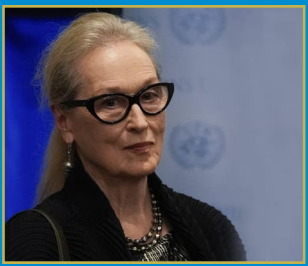
మహిళల కంటే పిల్లలకు స్వేచ్ఛ ఎక్కువ మగతా 2లో