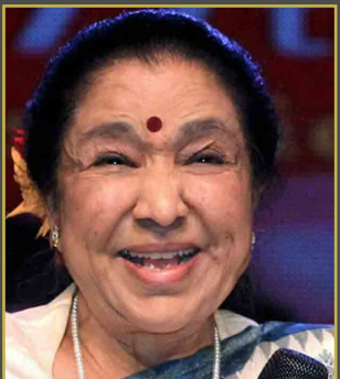
విదాకుల సంస్కృతి పెరగడానికి ఇవే కారణం మగతా 3లో