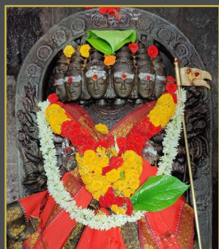
శ్రీ సుబ్రహ్మణ్యస్వామికి విశేష అభిషేకం