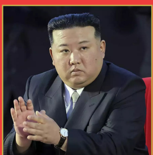
ప్రాఫెషనలిజం పేరుతో మంచి నిర్ణయాలపై దాడి..