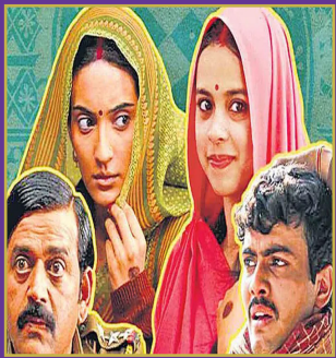
మనదేశం నుంచి ఆస్కార్ కు లాపతా లేడీస్