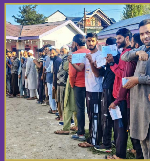
పదేళ్ల తర్వాత జమ్మూకశ్మీర్ లో అసెంబ్లీ ఎన్నికలు

దేశంలో ప్రజాస్వామ్యం మరియు శక్తివంతంగా, భాగస్వామ్యయుతంగా మార్చే కీలక ముందడుగు జమిలి విధానమని ప్రధానమంత్రి మోడీ ఏక్స్ వేదికగా స్పందించారు. దేశంలో జమిలి ఎన్నికలపై మాజీ రాష్ట్రపతి రామ్ నాథ్ కోవింద్ రూపొందించిన నివేదికకు కేంద్ర కేబినెట్ పచ్చజెండా ఊపిన విషయం తెలిసింది. దేశ వ్యాప్తంగా ఒకేసారి ఎన్నికలు నిర్వహించాలన్న కమిటీ సిఫార్సులను ఆమోదించింది. దీనిపై ప్రధాన మంత్రి నరేంద్ర మోడీ 'ఏక్స్' వేదికగా స్పందించారు. ఉన్నత స్థాయి కమిటీకి మిగతా 2లో