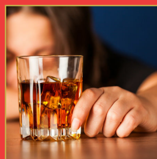
రోజూ ఆల్కహాల్ తీసుకుంటున్నారా...