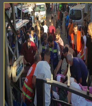
లెబనాన్ లో ఎందుకు పేజర్ వాడుతున్నారు..