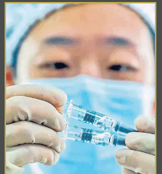
వుహాన్ ల్యాబ్ నుంచి కొవిడ్ నానో వ్యాక్సిన్