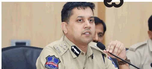
ముందడుగు హైదరాబాద్ :