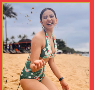
సిల్లీ విషయాలు పట్టించుకోను