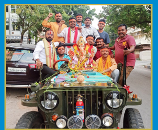
ప్రపంచానికే భారతదేశం ఆదర్శం