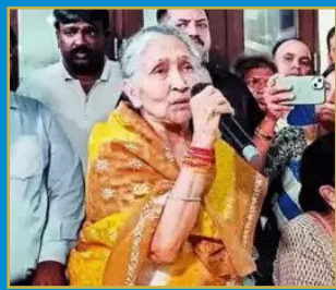
భారత సంపన్న మహిళ అన్ని కళ్లలో పోటీ