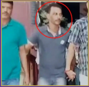
జూనియర్ వైద్యురాలిపై గ్యాంగ్ రేప్ కాదు

SIMULTANEOUSLY PUBLISHED FROM HYDERABAD | KARIMNAGAR | WARANGAL | JAGITYAL | KHAMMAM | NALGONDA | MAHABOBNAGAR | NIZAMABAD