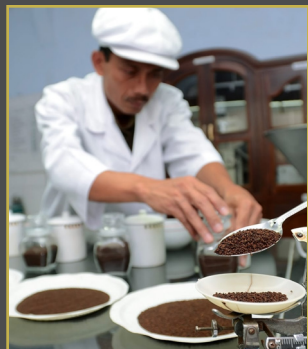
విడిగా విక్రయించే బీలో కట్టి యొక్క సూచికలు