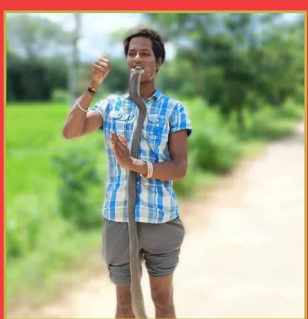
విష సర్పంతో యువకుడి విన్యాసం