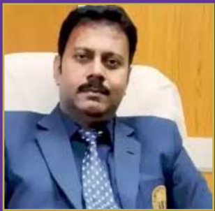
అత్యచారం జరిగిన స్థలంలో మరమ్మత్తు పనులు