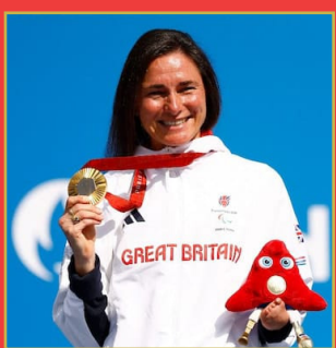
మహిళ పట్ల అంబులెన్స్ డ్రైవర్ అసభ్యకర ప్రవర్తన