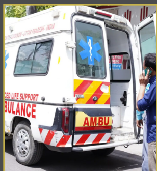
మహిళ పట్ల అంబులెన్స్ డ్రైవర్ అసభ్యకర ప్రవర్తన