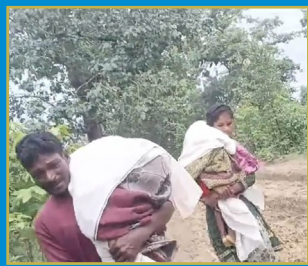
తల్లిదండ్రుల భుజాలపై పిల్లల శవాలు