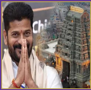
యాదగిరిగుట్ట వెంకటేష్ బోర్డు ఏర్పాటు చేయాలి