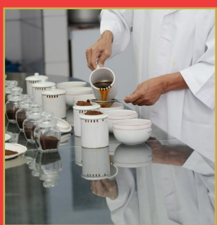
టీలో కత్తిని గుర్తించటం ఎలా