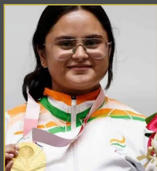
చరిత్ర సృష్టించిన అవని లేఖరా