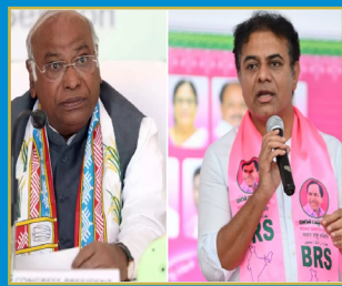
పేదలకు గూడు లేకుండా చేస్తున్నారు