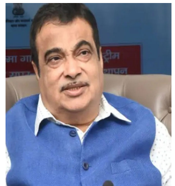
దేశంలో ఏటా 5 లక్షల రోడ్డు ప్రమాదాలు చోటుచేసుకుంటున్నాయి. 1.5 లక్షల మంది మరణిస్తున్నారు. మూడు లక్షల మంది గాయపడుతున్నారు. తద్వారా దేశ జీడీపీకి 3శాతం నష్టం వాటిల్లుతోంది. రోడ్డు ప్రమాదాలకు

డ్రైవర్లను బలిపశువులను చేస్తారు.. కానీ, రోడ్డు ఇంజనీరింగ్ లోనూ (డీపీఆర్) లోపాలున్నాయి" అని కేంద్ర మంత్రి నితిన్ గడ్కరీ పేర్కొన్నారు. దేశంలోని అన్ని హైవేలకు సీఫ్టీ ఆడిట్ నిర్వహించాల్సిన అవసరం ఉందని కేంద్ర మంత్రి పేర్కొన్నారు. రోడ్డు ప్రమాదాలను నివారించాలంటే.. లైసులో వెళ్లే క్రమశిక్షణ పాటించాలన్నారు. అంబులెన్సులు, వాటి డ్రైవర్లకు ప్రత్యేక కోర్సులను ఇచ్చేందుకు తమ మంత్రిత్వ శాఖ సిద్ధమవుతోందని అన్నారు. రోడ్డు ప్రమాదాల సమయంలో బాధితులను రక్షించేందుకు వేగంగా స్పందించడంతోపాటు.. కట్టర్ల వంటి అధునాతన పనిముట్లను వాడకంలో వారికి శిక్షణ ఇస్తామన్నారు.