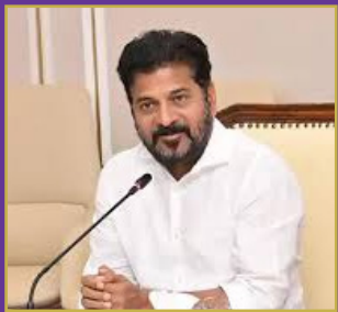
విద్యా సంస్థల ముసుగులో కబ్జా చేస్తే ఊరుకోం