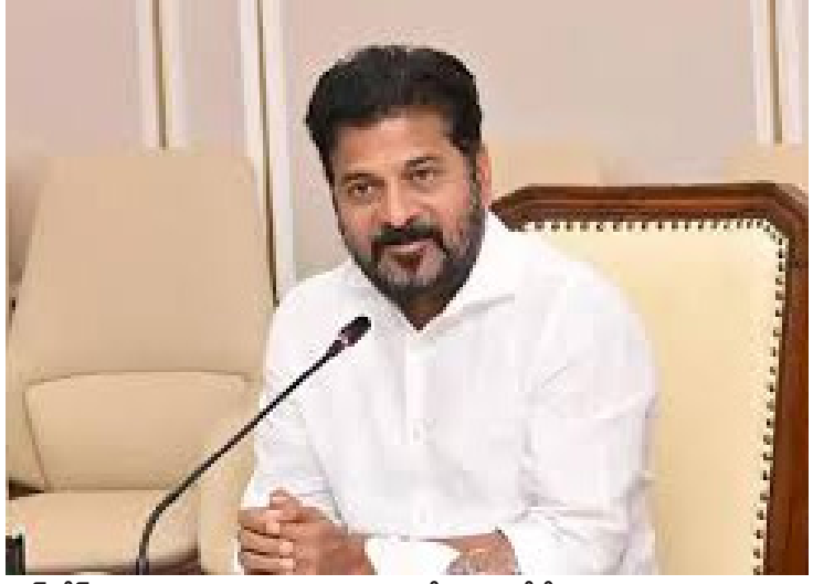
బఫర్ జోన్, చెరువులు, నాలాల ఆక్రమణల తొలగింపునకే మొదటి ప్రాధాన్యం. 30 ఏళ్ల కింద కట్టిన అక్రమ నివాస కట్టడాలైనా హైద్రా చర్యలు తీసుకుంటుంది. భారాస నేత హరిశ్చంద్రావు సిద్ధమైతే ఆయన

అక్రమ నిర్మాణాలు ఎఫ్టీఎల్, బఫర్ జోన్ లో ఎవరు నిర్మాణాలు చేసినా కూల్చివేస్తామని తెలంగాణ సీఎం రేవంత్ రెడ్డి స్పష్టం చేశారు. సచివాలయంలో మీడియాతో నిర్వహించిన చిట్ చాట్ లో ఆయన పలు ఆసక్తికర వ్యాఖ్యలు చేశారు. "సీడబ్ల్యూసీ సభ్యుడు పల్లం రాజు నిర్మాణాన్నే హైద్రా మొదట కూల్చివేసింది. జన్మాడ ఫామ్ పశాస్ లీజుకు తీసుకున్నట్లు అఫిడవిట్ లో కేటీఆర్ ఎందుకు ప్రస్తావించలేదు. నిర్మాణాలకు అధికారులే అనుమతి ఇస్తారు.. సర్పంచ్ లు కాదని పదేళ్లు మంత్రిగా పనిచేసిన ఆయనకు తెలియదా? నా కుటుంబం కబ్జా చేసినట్లు కేటీఆర్ చూపిస్తే దగ్గరుండి కూల్చివేయిస్తా. విద్యా సంస్థల ముసుగులో కబ్జా చేస్తే ఊరుకోం.