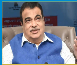
యుద్ధాల కంటే రోడ్డు ప్రమాదాల్లోనే ఎక్కువ మరణాలు