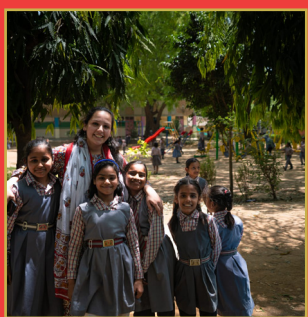
టీచ్ ఫర్ ఇండియా 2025 ఫెలోషిప్