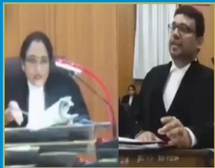
భర్త నుంచి నెలకు రూ.6 లక్షల భరణం డిమాండ్