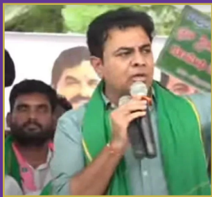
వాగ్దానాల అమలుపై సమాధానం లేదు