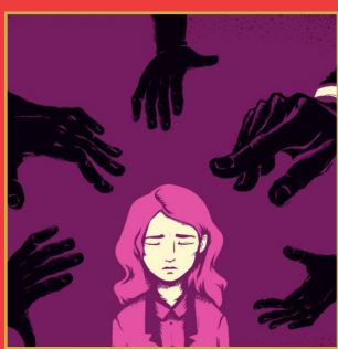
చట్టసభల్లోనూ మహిళ నిందితులు