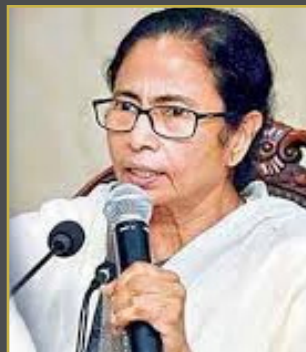
మహిళల నేరాలపై ఫాస్ట్ ట్రాక్ కోర్టులు రావాలి