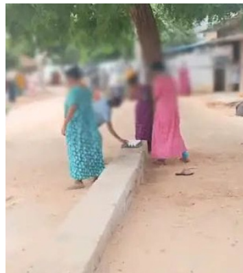
అనంతరం రాయచోటి ప్రభుత్వాసుపత్రికి తరలించి చికిత్స అందించారు.

మహిళను గ్రామస్థులు చెట్టుకు కట్టేసి చిత్రహింసలు పెట్టారు. కొందరు మహిళలు కర్రలతో కొడుతూ కొడిగుడ్లతో దాడికి పాల్పడ్డారు. ఈ అమానుష ఘటన అన్నమయ్య జిల్లా వీరబల్లి మండలం షికారిపాలెంలో జరిగింది. సదరు మహిళ ఇటీవల భర్త నుంచి విడిపోయి మరో పెళ్లి చేసుకున్నట్లు సమాచారం. ఈ క్రమంలో ఆమె తప్పచేసిందంటూ పలువురు మహిళలు చిత్రహింసలు పెట్టారు. స్థానికుల సమాచారంతో వీరబల్లి పోలీసులు బాధితురాలిని పీఎస్ కు తీసుకెళ్లారు. ఆమె నుంచి ఎస్పి ఫిర్యాదు తీసుకున్నారు.