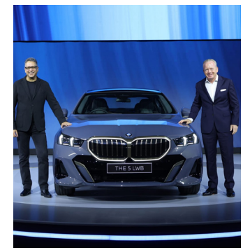
ప్రారంభించినప్పటి నుంచి 5 సిరీస్లు దాదాపు 10 మిలియన్ యూనిట్లు అమ్ముడయ్యాయి. మిస్టర్ విక్రమ్ పవాహ్,

ముందడుగు హైదరాబాద్: బిఎండబ్ల్యూ 5 ఇండియా ఆల్-న్యూ బిఎండబ్ల్యూ 5 సిరీస్ లాంగ్ వీల్ బేస్ను విడుదల చేసింది. ఇండియాలోని బిఎండబ్ల్యూ డీలర్షిప్లలో మరియు www.bmw.in లో ఈ కారును బుక్ చేసుకోవచ్చు. సెప్టెంబర్ 2024 నుంచి డెలివరీలు ప్రారంభమవుతాయి. ఈ బిఎండబ్ల్యూ 5 సిరీస్ బిఎండబ్ల్యూ బ్రాండ్ ప్యాదయంలో ఉంది. ప్రపంచవ్యాప్తంగా, ఇది ప్రతిష్టాత్మక ఎగ్జిక్యూటివ్ సెడాన్ సెగ్మెంట్లో కొన్నేళ్లుగా మార్కెట్లో లీడర్గా ఉంది. మొదటి తరం 1972లో