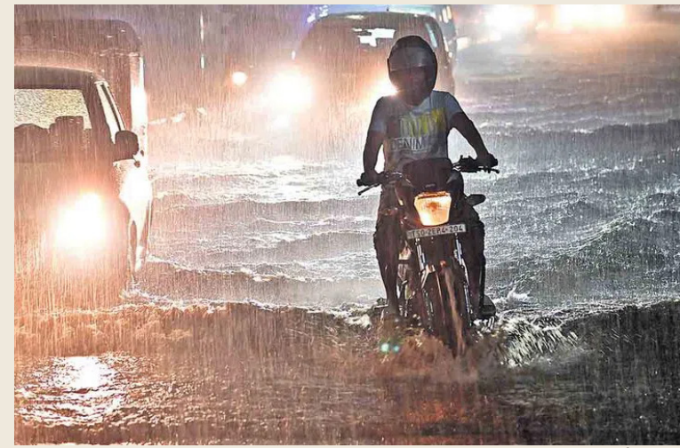
ముందడుగు: తెలంగాణలో వచ్చే ఐదురోజుల్లో భారీ వర్షాలు కురిసే అవకాశం ఉన్న నేపథ్యంలో పలు జిల్లాలకు హైదరాబాద్ వాతావరణ కేంద్రం ఆరెంజ్ అలర్ట్ ప్రకటించింది. సముద్రమట్టానికి 5.8 కిలోమీటర్ల ఎత్తులో కొస్తాండ్ల ప్రదేశ్ లో

పశ్చిమ మధ్య బంగాళాఖాతంలో శనివారం ఏర్పడిన ఆవర్తనం పశ్చిమబెంగాల్ మీదుగా ఏర్పడిన ఆవర్తనంలో కలిసిపోయిందని పేర్కొన్నది. నేటి నుంచి ఐదు రోజుల పాటు ఆయా జిల్లాల్లో ఉరుములు, మెరుపులు, ఈదురుగాలులతో కూడిన భారీ వర్షాలు కురియవచ్చని పేర్కొన్నది. ఆదివారం హైదరాబాద్ లో భారీ వర్షం కురిసింది. చాలా ప్రాంతాల్లో ప్రధాన రోడ్లపైకి వరద చేరడంతో, వాహనాల రాకపోకలకు అంతరాయం ఏర్పడింది. దీంతో నగరంలో ట్రాఫిక్ పెద్ద ఎత్తున నిలిచిపోయింది. ముఖ్యంగా మాదాపూర్, హైటెక్ సిటీ మార్గంలో ట్రాఫిక్ జామ్ అయ్యింది. ప్రత్యామ్నాయ మార్గాల్లో వెళ్లాలని ట్రాఫిక్, జీహెచ్ఎంసీ సిబ్బంది విహనదారులను కోరారు. యూసెఫ్ గూడలోని శ్రీకృష్ణనగర్ లో ఓ కారు వరదలో కొట్టుకుపోయింది.