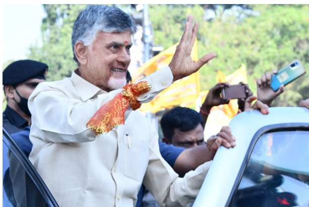
విజయానికి తెలంగాణ తెదేపా శ్రేణులు పరోక్షంగా కృషి చేశారు. వారందరికీ ధన్యవాదాలు. ఎన్టీఆర్ అనేక పరిపాలనా సంస్కరణలు

తీసుకొచ్చారు. సంక్షేమానికి నాంది పలికిన నాయకుడు ఆయన. తెలంగాణలో అధికారంలో లేకున్నా కార్యకర్తలు పార్టీ వదలేదు. పార్టీ