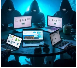
లాగిన్ సమాచారం కూడా లీక్ Rockyou2024 అనేక ఆన్లైన్ ఖాతాలకు అక్రమ యాక్సెస్ పొందిన తర్వాత చాలా మంది నటీనటుల పాస్ వర్డ్ లను పొందినట్లు చెప్పారు. చాలా మంది ఉద్యోగుల డేటా కూడా లీక్ అయింది. పాత, కొత్త డేటా లీక్ల సహాయంతో ఈ సమాచారం అందింది. ఈ మిశ్రమ డేటా లీక్ తో పాటు, ఇమెయిల్ చిరునామాలు, అనేక లాగిన్ సమాచారం కూడా లీక్ అయ్యాయి. వ్యక్తుల గుర్తింపును దొంగిలించడానికి, ఆర్థిక నేరాలకు Rockyou2024 బాధ్యత వహిస్తుందని నివేదికలో పేర్కొంది. అయితే Rockyou2024 పాస్ వర్డ్ లీక్ కావడం ఇదే తొలిసారి. ఇంతకు ముందు హ్యాకర్లు 8.4 బిలియన్ ఫ్లెయిన్ టెక్స్ట్ పాస్ వర్డ్ లను లీక్ చేశారని నివేదికలో పేర్కొన్నారు.

ముందడుగు కైం: ప్రస్తుత రోజుల్లో ఏది నిజమో, ఏది ఆబద్ధమో తెలియని పరిస్థితి నెలకొంది. రోజురోజుకూ సైబర్ సెక్యూరిటీ ముప్పు పెరుగుతోంది. కొన్ని కంపెనీల డేటా లీక్ అయినట్లు తరచుగా వార్తలు వస్తుంటాయి. ఇప్పటివరకు అతిపెద్ద డేటా లీక్ జరిగిందన్న సమాచారం వెలుగులోకి వచ్చింది. దాదాపు 995 కోట్ల పాస్ వర్డ్ లు లీక్ అయ్యాయి. ఈ పాస్ వర్డ్ లీక్ ఇప్పటివరకు జరిగిన అతిపెద్ద లీక్ అని నిపుణులు చెబుతున్నారు. నివేదికలో షాకింగ్ సమాచారం ఒబామాకేర్ అనే హ్యాకర్ 995 కోట్ల పాస్ వర్డ్ లను లీక్ చేశాడు. గురువారం నాటి Rockyou2024 నివేదికలో ఈ సమాచారం వెలుగులోకి వచ్చింది. Rockyou2024 ప్రపంచవ్యాప్తంగా ఒకే స్థాయిలో ఉపయోగించే పాస్ వర్డ్ లు లీక్ అయినట్లు నివేదిక పేర్కొంది. లీక్ అయిన పాస్ వర్డ్ లలో చాలా మంది నటీనటుల వివరాలు కూడా ఉన్నాయని నివేదిక వెల్లడించింది.