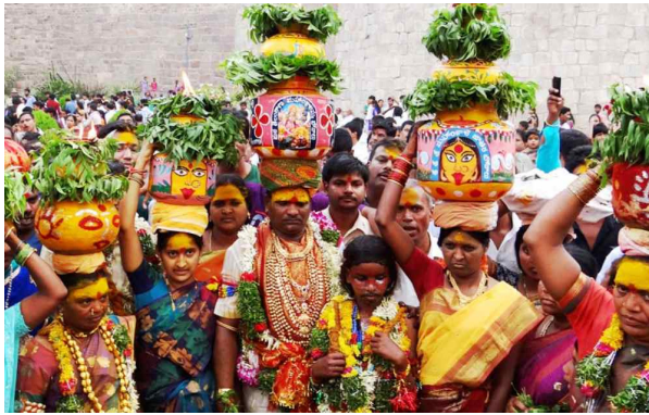
గోల్కొండలోని జగదాంబిక అమ్మవారి తొలిపూజకు ప్రభుత్వం తరపున దేవదాయ శాఖ మంత్రి

ముందడుగు హైదరాబాద్: భాగ్యనగరంలో ఆషాఢ మాసం బోనాల పండగ ఆదివారంనాడు వైభవంగా ప్రారంభమైంది. శివసత్తుల పూనకాలతో డప్పు చప్పుళ్లు, పోతరాజుల విన్నాసాల హైదరాబాద్ నగరం మార్చి గుఱింది. గోల్కొండ జగదాంబిక అమ్మవారికి తొలి బోనం సమర్పించడంతో బోనాల పండుగ నేడు ప్రారంభమైంది. ఆదివారం తెల్లవారుజాము నుంచే భక్తులు కుటుంబ సభ్యులతో కలిసి పెద్ద సంఖ్యలో గోల్కొండ కోటకు చేరుకున్నారు.