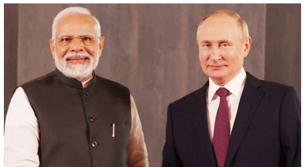
అక్కడి వ్యాపార ప్రముఖులను ఒప్పందం ప్రసంగిస్తారు. మాస్కో, వియన్నాల్లోని ప్రవాస భారతీయులతోనూ సంభాషిస్తారు" అని విదేశాంగశాఖ ఒక ప్రకటనలో తెలిపింది.

ఏళ్లలో ఇదే ప్రథమం. "రష్యా అధ్యక్షుడు పుతిన్ ఆహ్వానం మేరకు ప్రధాని మోడీ ఈ నెల 8, 9వ తేదీల్లో ఆ దేశంలో పర్యటించనున్నారు. 22వ భారత్- రష్యా వార్షిక శిఖరాగ్ర సమావేశంలో పాల్గొంటారు. ఇరుదేశాల మధ్య సంబంధాలను నేతలిద్దరూ సమీక్షిస్తారు. ప్రాంతీయ, ప్రపంచ అంశాలపై చర్చలు జరుపుతారు. అనంతరం ఆస్త్రియాను సందర్శించనున్నారు. స్థానిక నేతలతో సమావేశమవుతారు.