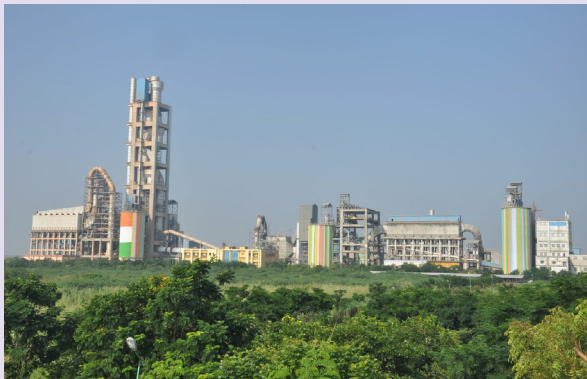
నిబద్ధతను బలపరుస్తుంది. మొత్తం ఇన్ ఫ్రాస్ట్రక్చర్ క్యాపిటల్ అవుట్ లే మరియు దాని విస్తరణపై ఆశించిన దృష్టితో, ముఖ్యంగా దక్షిణాది రాష్ట్రాల్లో మేము నాణ్యమైన ఉత్పత్తులను అందించడంలో ప్రధాన పాత్ర సాగించామని తెలిపారు.