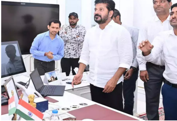
దరఖాస్తుదారుల బ్యాంక్ అకౌంట్ కోడ్ని ఇస్తారు. ఆ కోడ్ ఆధారంగా నంబర్ తప్పనిసరిగా ఇవ్వాలి ఉంటుంది. అప్లోడ్ చేసిన తర్వాత సీఎంఆర్ఎఫ్కు సంబంధించిన ఒక

అప్లికేషన్ను సంబంధిత ఆసుపత్రిలకు పంపి నిర్ధారించుకుంటారు. వివరాలు అన్నిసరిగా ఉంటే అప్లికేషన్ను ఆమోదించి చెక్ సిద్ధం చేస్తారు. చెక్పై తప్పనిసరిగా దరఖాస్తుదారుడి అకౌంట్ నెంబర్ను ప్రింట్ చేస్తారు. ఆ తర్వాత ప్రజాప్రతినిధులు చెక్లను స్వయంగా దరఖాస్తుదారులకు అందజేస్తారు.