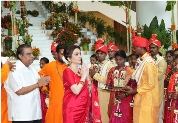
రాబోయే రోజుల్లో ఇలా మరిన్ని వివాహాలు జరిపిస్తామని ముకేష్ కుటుంబం పేర్కొంది.

ముందడుగు జాతీయం: లలయన్స్ ఇండస్ట్రీస్ అధినేత ముకేష్ అంబానీ తన కుమారుడి వివాహ వేడుకల్లో భాగంగా మంగళవారం పేద కుటుంబాలకు చెందిన 50 జంటలకు సామూహిక పెళ్లెళ్లు జరిపించారు. ముంబయి సమీపంలోని లలయన్స్ కార్పొరేట్ పార్క్ ఇండుకు వేదికైంది. దీనికి లలయన్స్ ఇండస్ట్రీస్ అధినేత ముకేష్ అంబానీ, ఆయన సతీమణి నీతా అంబానీ, పెద్ద కుమారుడు ఆకాశ్, కోడలు శ్లోక, కుమార్తె ఈశా, అల్లుడు ఆనంద్ హాజరయ్యారు. అలాగే కొత్త జంటల తరపున కొందరు బంధువులు ఈ కార్యక్రమంలో భాగమయ్యారు.