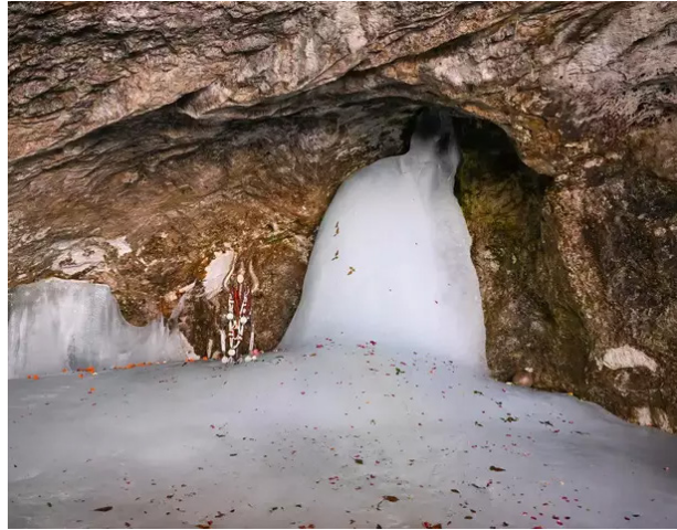
రక్షాబంధన్, శ్రావణి పూర్ణిమతో ముగుస్తుంది. ప్రతి సంవత్సరం లక్షలాది మంది ఇక్కడికి సందర్శిస్తుంటారు. మరో

మొదటిపేజీ తరువాయి తన అధికారిక పోస్ట్లో పోస్ట్ చేశారు. బాబా అమర్నాథ్ జీ ఆశీర్వాదం తీసుకొని ప్రజలందరికీ మంచి ఆరోగ్యం, పురోగతి, శ్రేయస్సు కోసం ప్రార్థించారు. కాశ్మీర్ హిమాలయాలలో సముద్ర మట్టానికి 3,888 మీటర్ల ఎత్తులో ఉన్న గుహ దేవాలయానికి పవిత్ర యాత్ర ఎల్లప్పుడూ మత సామరస్యానికి చిహ్నంగా ఉందని.. యాత్రికులు గుహ ఆలయానికి చేరుకోవడానికి స్థానిక ముస్లింలు సహాయపడుతున్నారని ఆయన పేర్కొన్నారు. అమర్నాథ్ యాత్ర ఈ ఏడాది జూన్ 29 నుంచి యాత్ర ప్రారంభం కానుంది. 52 రోజుల పాటు సాగే ఈ యాత్ర ఆగస్టు 19న