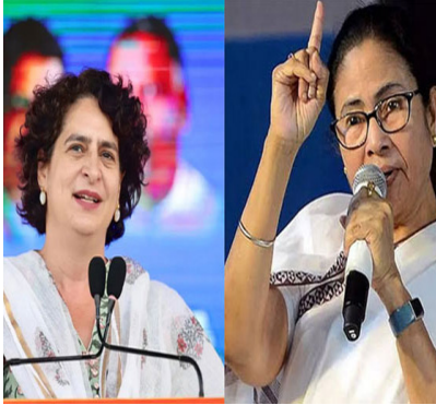
దీంతో ఈ స్థానంలో ప్రియాంక పోటీకి దిగుతున్నారు. 2019 నుంచి రాజకీయాల్లో క్రియాశీలక పాత్ర పోషిస్తున్న ప్రియాంక

ముందడుగు జాతీయం: కాంగ్రెస్ పార్టీ ప్రధాన కార్యదర్శి ప్రియాంకగాంధీ వయనాడ్ నుంచి రాజకీయ అరంగేట్రం చేయనున్నారని ఇటీవల కాంగ్రెస్ ప్రకటించింది. ఇందులో భాగంగా ప్రియాంకకు మద్దతుగా పశ్చిమబెంగాల్ ముఖ్యమంత్రి మమతా బెనర్జీ వయనాడ్ లో ప్రచారం చేసే అవకాశం ఉందనే వార్తలు వినిపిస్తుండడంతో రాజకీయ వర్గాల్లో ఆసక్తి నెలకొంది. లోక్ సభ ఎన్నికల్లో రాహుల్ గాంధీ రాయబరేబి, వయనాడ్ లో పోటీ చేసి రెండు స్థానాల్లోను భారీ మెజారిటీతో గెలుపొందారు. రెండు స్థానాల్లో గెలిచినవారు ఒక స్థానాన్ని వదులుకోవాలనే నియమం ప్రకారం ఆయన వయనాడ్ స్థానాన్ని వదులుకున్నారు.