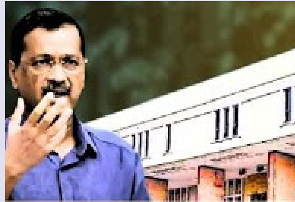
తిరస్కరించారు. రూ.లక్ష వ్యక్తిగత బాండ్ పూచీకత్తుపై కేజ్రీవాలను విడుదల చేయాలని ఆదేశించారు.

ముందడుగు ఢిల్లీ: మధ్యం పాలసీకి సంబంధించి మనీలాండరింగ్ కేసులో అరవింద్ కేజ్రీవాలకు ట్రయల్ కోర్టు ఇచ్చిన బెయిల్ ఉత్తర్వులపై ఢిల్లీ హైకోర్టు స్టే విధించింది.