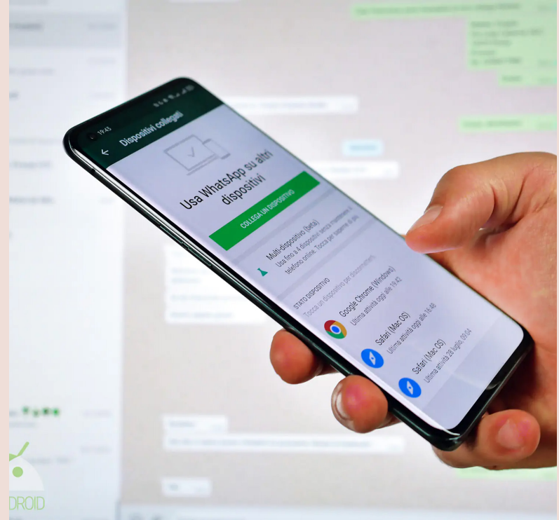
ఫోటోలు లేదా ఆడియో సందేశాలకు ఉపయోగపడదు. అలాగే, ఈ ఫీచర్ ఆండ్రాయిడ్

ప్రస్తుత రోజుల్లో ప్రపంచవ్యాప్తంగా కోట్లాది మంది వాట్సాప్ ఉపయోగిస్తుంటారు. దీంతో మెసేజ్ లు, ఫోటోలు, వీడియోలు సులభంగా షేర్ చేసుకోవచ్చు. యాప్ లో కాలింగ్, వీడియో కాలింగ్ సౌకర్యం కూడా అందుబాటులో ఉంది. గోప్యతని దృష్టిలో ఉంచుకుని యాప్ లో అనేక గోప్యతా ఆధారిత ఫీచర్లు కూడా అందించబడ్డాయి. అలాంటి ఒక ఫీచర్ డిలిట్ ఫర్ ఎన్ట్రీవస్. దీని కారణంగా, లిస్టర్, పంపిన వారి చాట్ ల నుండి మెసేజ్ లు డిలిట్ అయిపోతాయి. కానీ, ఇది తొలగించబడిన మెసేజ్ ల జాడను వదిలివేస్తుంది. కొన్ని మెసేజ్ లు పంపబడినట్లు, తొలగించబడినట్లు చూపుతుంది. చాలా మంది డిలిట్ అయిన మెసేజ్ లలో ఏముందో తెలుసుకోవడానికి ప్రయత్నిస్తారు. దీని కోసం కొన్ని థర్డ్ పార్టీ యాప్ లు ఉన్నాయి, కానీ వాటిని ఉపయోగించడం ప్రమాదకరం. అందువల్ల Android ఫోన్ లలో అందుబాటులో ఉన్న ఇన్-బిల్ట్ ఫీచర్ గురించి ఇప్పుడు చూద్దాం, దీని ద్వారా తొలగించబడిన మెసేజ్ లను చదవవచ్చు. తొలగించబడిన టెక్స్ మెసేజ్ లు మాత్రమే దీని ద్వారా చెక్ చేయవచ్చు. ఈ ఫీచర్