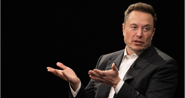
తిరిగి మొదటి స్థానంలో నిలిచారు. ప్యాకేజీకి ఆమోదముద్ర పడింది. 56 ఇటీవల జరిగిన టెస్లా సాధారణ వార్షిక సమావేశంలో మస్క్ వేతన ఇచ్చేందుకు ఇన్వైట్ చేశారు.

ముందడుగు జాతీయం టెస్లా సీఈఓ ఎలాన్ మస్క్ మళ్లీ ప్రపంచ కుబేరుల జాబితాలో తొలి స్థానానికి చేరుకున్నారు. బ్లూమ్ బర్గ్ ఇలియనీర్ ఇండెక్స్ తాజా నివేదిక ప్రకారం.. 208 బిలియన్ డాలర్ల నికర విలువతో బెజ్జోస్ ను వెనక్కి నెట్టి మొదటి స్థానానికి చేరుకున్నారు. 205 బిలియన్ డాలర్లతో జెఫ్ బెజ్జోస్, 199 బిలియన్ డాలర్లతో బెర్నార్డ్ ఆర్బాల్ట్ తర్వాతి స్థానంలో నిలిచారు. చాలా కాలం నుంచి ఈ ముగ్గురి మధ్య గట్టి పోటీ నడుస్తోంది. తాజాగా టెస్లా షేర్లు రాణించడంతో మస్క్