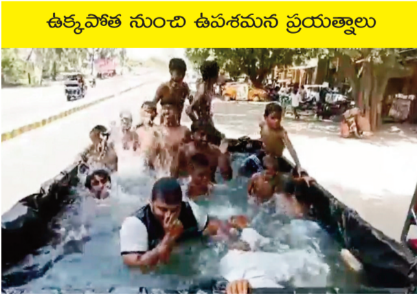
ఉక్కపోత నుంచి ఉపశమన ప్రయత్నాలు

దేశంలోని ఉత్తరభారతంలో కొన్ని రాష్ట్రాల్లో భానుడు మండిపోతున్నాడు. రికార్డు స్థాయిలో ఎండలు మండిపోతున్నాయి. దీంతో ప్రజలు అల్లాడుతున్నారు. ఉక్కపోత నుంచి ఉపశమనం కోసం రకరకాల ప్రయత్నాలు చేస్తున్నారు. మొన్న ఓ యూట్యూబర్ కారులోనే మినీ స్విమ్మింగ్ పూల్ ను ఏర్పాటు చేసి చిక్కల్లో పడిన విషయం తెలిసిందే. తాజాగా ఉత్తరప్రదేశ్ కు చెందిన కొందరు ఏకంగా ట్రాక్టర్ ట్రాలీని మినీ స్విమ్మింగ్ పూల్ గా మార్చేశారు. అమోహాకి చెందిన కొందరు వ్యక్తులు ట్రాక్టర్ ట్రాలీని స్విమ్మింగ్ పూల్ గా మార్చేశారు. నీరు లీక్ అవుతుందా ట్రాలీని మొత్తం ఓ మందపాటి పట్టణం వరకు చేశారు. అందులో నీళ్లు నింపి చిన్నారులు, కొందరు యువత స్విమ్మింగ్ చేస్తూ కనిపించారు. నీటిలో మునుగుతూ ఉక్కపోత నుంచి ఉపశమనం పొందుతూ కనిపించారు. ఇందుకు సంబంధించిన వీడియో ప్రస్తుతం వైరల్ గా మారింది.