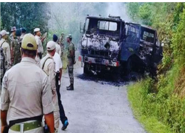
ఎన్నికల సమయంలో తమ వద్ద నుంచి లైసెన్స్ తుపాకులను జప్తు చేయడంతో వాటిని తిరిగి ఇచ్చేయాలంటూ స్థానికులు జిల్లా పోలీస్ స్టేషన్ ఎదుట నిరసనకు దిగారు. ఇలా కొన్ని రోజులుగా అశాంతి నెలకొన్న ఈ ప్రాంతాన్ని సందర్శించాలని సీఎం బీ

మణిపూర్ లో ముఖ్యమంత్రి బీరేన్ సింగ్ సెక్యూరిటీ కాన్వాయ్ పై దాడికి ప్రయత్నాలు జరిగాయి. సోమవారం ఉదయం సాయుధులైన కొందరు తీవ్రవాదులు కాల్పులకు తెగబడ్డారు. సీఎం కాన్వాయ్ నుంచి చెందిన వర్గాలు ఈ విషయాన్ని వెల్లడించాయి. ఈ ఘటన కాంగ్రెస్ పోజీ జిల్లాలో చోటుచేసుకొంది. ఇటీవల జిరిబామ్ జిల్లాలో ఓ వ్యక్తిని గుర్తు తెలియని దుండగులు దారుణంగా హత్య చేసిన సంగతి తెలిసిందే. ఈ ఘటనతో రాష్ట్రంలో ఉద్రిక్తతలు తీవ్రంగా మారాయి. 70కి పైగా ఇళ్లను తగలబెట్టడంతో ఉద్రిక్త పరిస్థితులు నెలకొన్నాయి. మరికొందరు పౌరులు వేరే చోటుకు పారిపోయినట్లు తెలుస్తోంది.