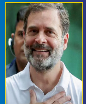
రెండు చోట్ల రావణల్ల ఘన విజయం