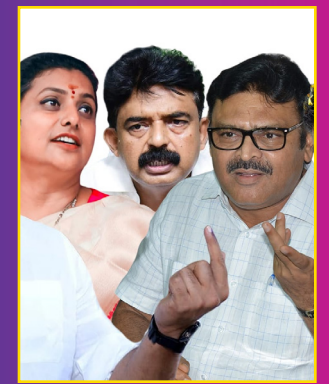
ఘోర పరాజయానికి భాష కూడా కారణమే