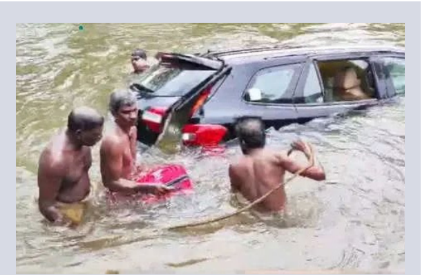
గూగుల్ మ్యాప్స్ చూస్తూ డ్రైవింగ్