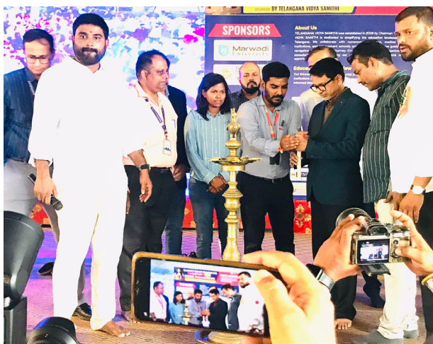
ఉప్పల్ శిల్పరామంలో కిక్కిరిసిన