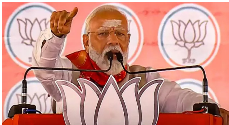
ఈ కుటుంబ నేపథ్యం ఉన్నవారు ఎంపీ స్థానాలకు వీలునామా రాస్తున్నారు. ఇలాంటి కుటుంబ పార్టీల నుంచి రూర్ఖండ్ ను కాపాడాలి" అని పిలుపునిచ్చారు.

కూడా మీకు కనిపించలేదా? వారంతా (గాంధీ కుటుంబం) ఈ స్థానాన్ని తమ కుటుంబ ఆస్తిగా భావిస్తున్నారు" అని మోడీ విమర్శలు గుప్పించారు. వయనాడ్ నుంచి పోటీ చేసిన రాహుల్ గాంధీ.. ఆ తర్వాత రాయ్ బరేలీ నుంచి సిద్ధమవ్వడంపై ప్రధాని మండిపడ్డారు. ఎన్నికల్లో పోటీ చేసేందుకు కాంగ్రెస్ యువరాజ్ (రాహుల్ ను ఉద్దేశిస్తూ) వయనాడ్ నుంచి ఇప్పుడు రాయ్ బరేలీకి పారిపోయారని ఎద్దేవా చేశారు. "స్కూలుకు వెళ్లే ఎనిమిదేళ్ల పిల్లడు.. తన తండ్రి అక్కడ చదువుకున్నప్పటికీ.. అలా చెప్పుకోడు. రాయ్ బరేలీ వెళ్లిన రాహుల్ మాత్రం ఇది తన తల్లిది అని చెబుతూ తిరుగుతున్నారు.