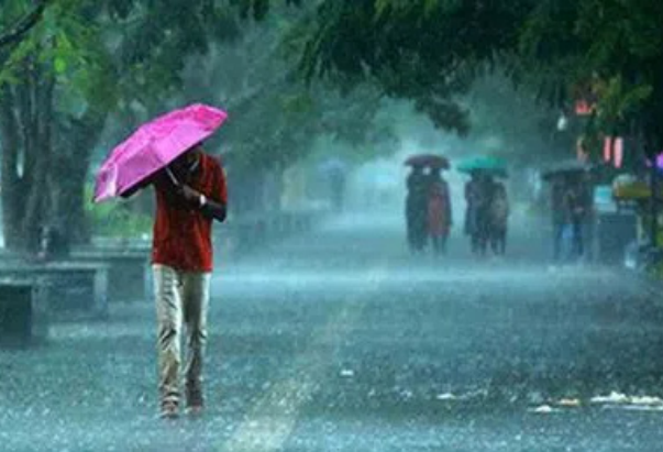
ని చెప్పింది. బుధ, గురువారాల్లోనూ లున్నాయని హైదరాబాద్ వాతావరణ కేంద్రం వివరించింది. పలు జిల్లాల్లో వానలు పడే అవకాశా