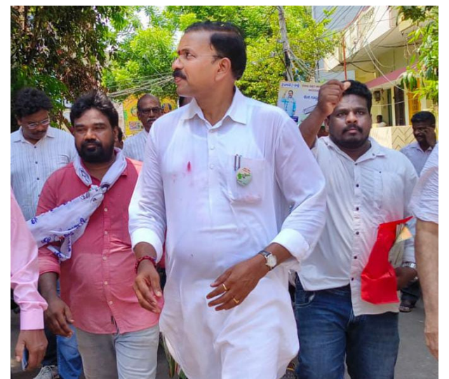
అసక్తిగా గమనిస్తున్న ఓటరు