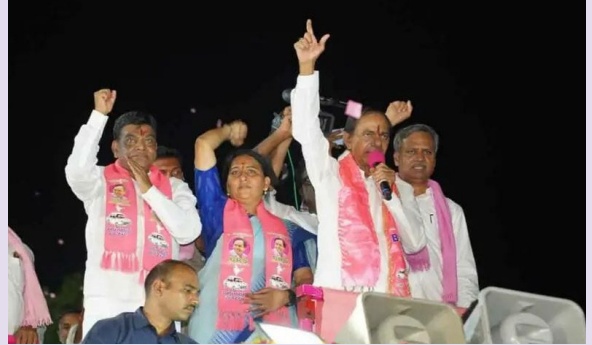
పండాని కోట్ల రూపాయలు ఖర్చు పెట్టి త్రీ ఫేజ్ కరెంటు ఇప్పించినం. ఇయ్యాల అక్కడ మోటార్లు కాలు తున్నయ్. పొలాలు ఎండిపోతున్నయ్, రైతులు బాధపడుతున్నయ్' అని కేసీఆర్ ఆవేదన వ్యక్తం చేశారు.