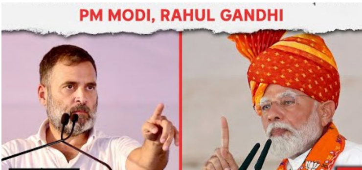
PM MODI, RAHUL GANDHI