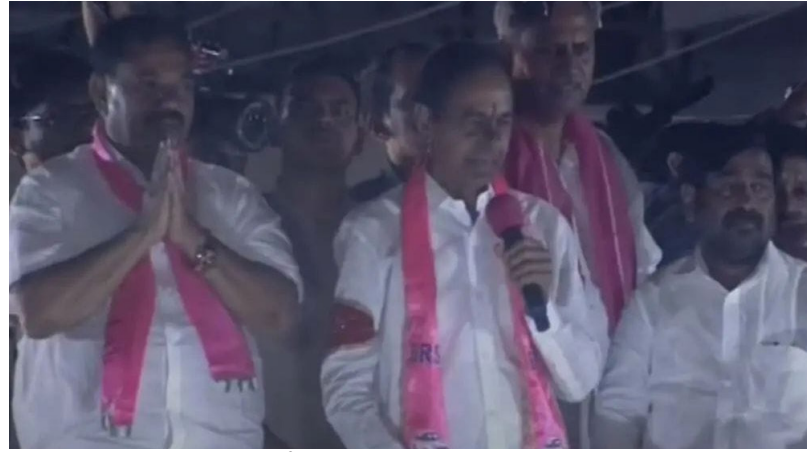
ని చెప్పారా? రైతుబంధు అందరికీ వచ్చిందా? రో తెలియడం లేదని కేసీఆర్ కాంగ్రెస్ సర్కారుపై రాలేదు కదా? అదికూడా ఉంటడో.. ఊడగొడుత కేసీఆర్ మండిపడ్డారు.